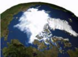
北極海の氷が半減